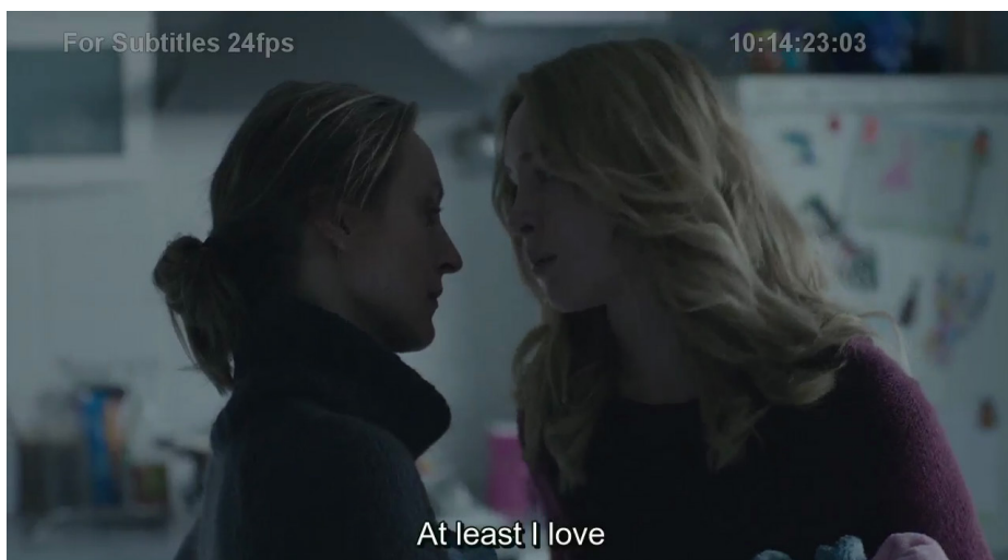
Rysunek 2. Kadr z filmu Nowy świat , reż. E. Benkowska, Ł. Ostalski, M. Wawrzecki.