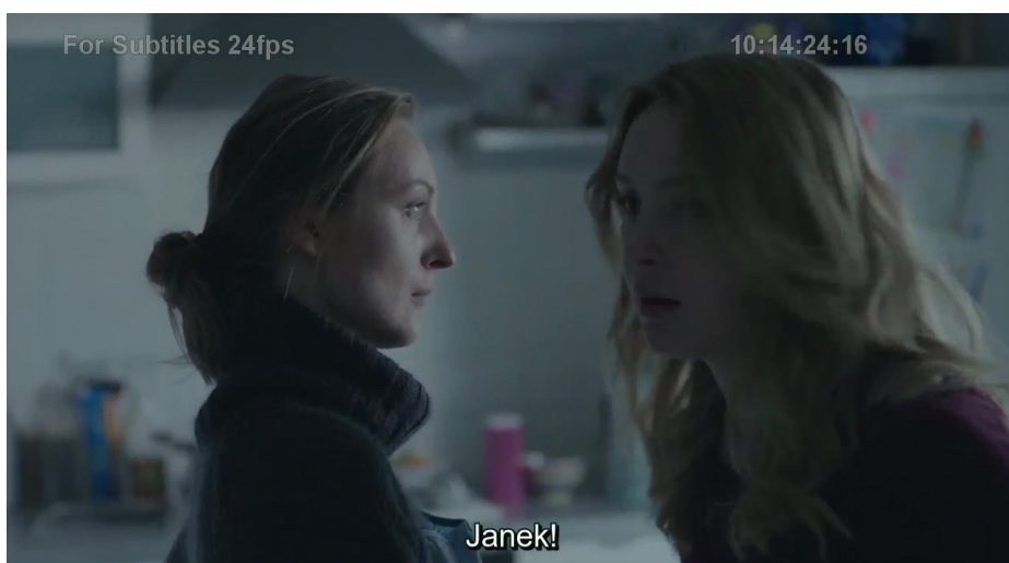
Rysunek 3. Kadr z filmu Nowy świat , reż. E. Benkowska, Ł. Ostalski, M. Wawrzecki 12 .