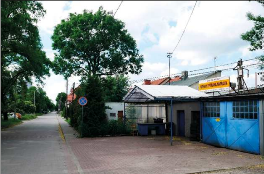
FOT. 4 Dawna kuźnia, obecnie warsztat mechanika

Uwaga: W miejscu znaku drogowego był kiedyś przystanek linii 104.