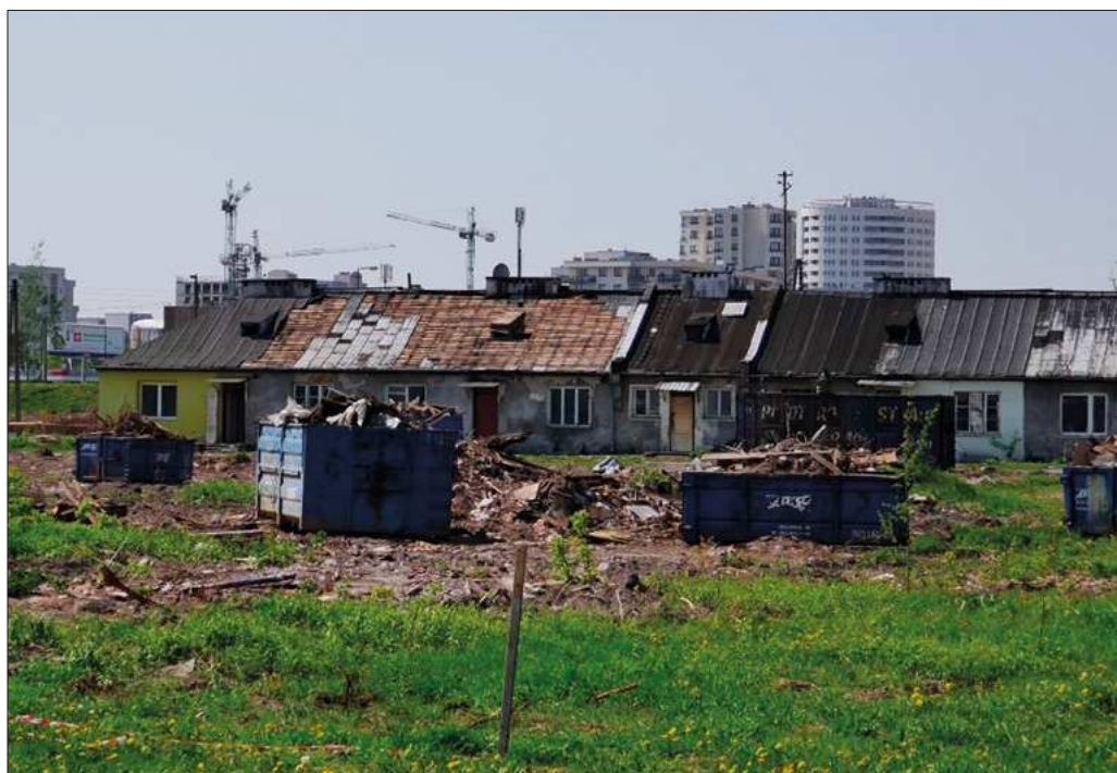
FOT. 2 Czworak pracowników PGR-u

Pracowników PGR-u zakwaterowano w specjalnie dla nich wybudowanych czworakach. Zostały zburzone dopiero w 2018 r. Prawdopodobnie stałyby tam do dziś, gdyby nie budowa Południowej Obwodnicy Warszawy. Jej trasa będzie przebiegać przez środek dawnych zabudowań PGR-u.