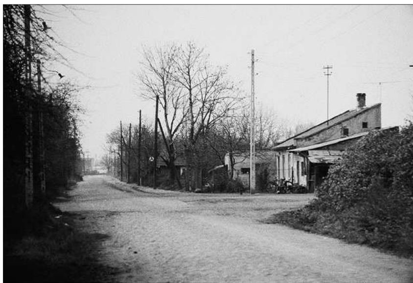
FOT. 3 Pętla autobusu linii 104

Autobus 104 był przez dziesięciolecia jedynym łącznikiem Wolicy z miastem. Do lat 80. XX w., kiedy powstały pierwsze bloki osiedla Natolin, na „głębokie południe” Warszawy można było dojechać wyłącznie linią 104. Pętla autobusowa o nazwie „Wolica” mieściła się przy ul. Nowoursynowskiej, która jeszcze pod koniec ubiegłego wieku była pokryta kocimi łbami. Tuż obok pętli znajdowała się kuźnia, w której pracował kowal. Jeszcze do niedawna podkuwano tam konie ciągnące wolickie furmanki. Budynek przetrwał. Obecnie mieści się w nim zakład mechanika samochodowego.