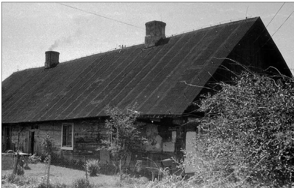
FOT. 1 Chata turecka w latach 90. XX w.

Na południowym krańcu Wolicy znajdował się folwark. Jak wspominałam, jeszcze przed II wojną światową jego właścicielami byli Branicczy. Jednym z bardziej charakterystycznych budynków pamiętających te czasy był olbrzymi czworak, największy w całej wsi. Jeszcze na początku XXI w. mieszkali w nim potomkowie służby Branickich 18 . Budynek nazywano chatą turecką. Legenda głosi, że chata ta pochodzi z XVII w. Jej pierwszymi mieszkańcami mieli być janczarzy sprowadzeni tu przez króla Jana III Sobieskiego 19 . W materiałach źródłowych próżno by szukać potwierdzenia tej tezy. Pewne jest to, że chata była jedną z najstarszych na terenie dzisiejszego Ursynowa. Spłonęła w 2011 r. Po drugiej wojnie światowej na bazie folwarku powstał PGR Wolica. W 1956 r. właścicielem gruntów została SGGW, która urządziła swoje pole doświadczalne. Tak wspomina je Pani Beata: