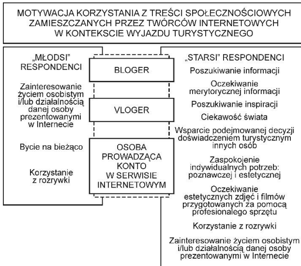
Rysunek 2. Motywacje korzystania z treści autorstwa twórców internetowych w kontekście wyjazdu turystycznego

internetowych, którego częścią mogły być podróże, ale przede wszystkim materiałami związanymi z modą, urodą i grami komputerowymi.